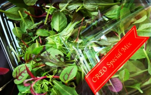
茎は長め、歯ごたえボリューム感あり

弊社で扱っております内の、一番小さなリーフである「トッピングリーフ」のミックスです。まるで天使のようにお皿の上を舞い降りる7種のリーフ、フワリとした容姿も美しいそんな夢のようなミックスでプレミアム感を演出してください。他のどこにもない繊細さが目を引きまします。