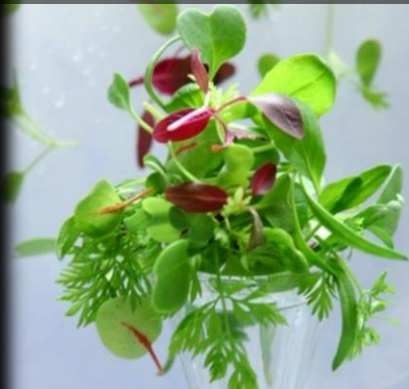
トッピングリーフミックスの大人気商品

自然な美しい赤紫色をまるでフラワーアレンジメントのように小さなリーフで楽しめたらと誕生いたしましたのが「マイクロミックス・フィオレ」です。6可愛らしいサラダで食べていただいても、あるいは一つ一つをメインディッシュの美しいトッピングやアミューズ、セイボリーにも魅力いっぱいにお使いいただけます。