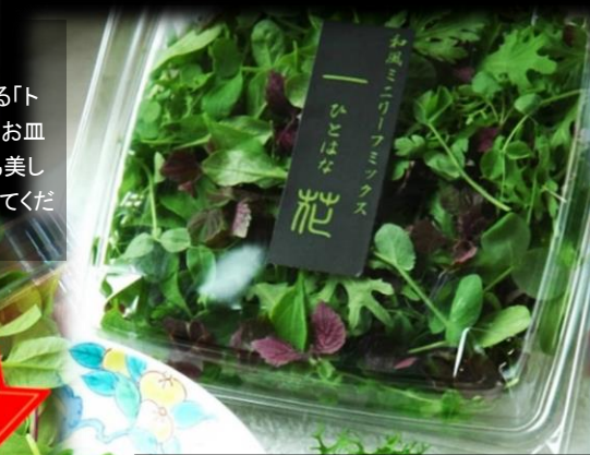
和の趣きを表現したミニリーフミックス

リーフの中でも一番小さなサイズのマイクロリーフミックス。今までとは少し尖ったアプローチの ハーブの香り と スパイシーさ をもったミックスで、小さなトッピングリーフですが、メイン料理に負けないインパクトがあります。レッドとグリーンとの配合もバランス良く入れました。濃い味のソースと併せても主張するような「味」もあるミックスです。特徴のあるリーフを集めましたので軽く散らしてプレート飾っても美しく映えます。もちろんそのまま、ハーブサラダとして添えても美しい。見た目も味もゆっくりと楽しめる、7種のリーフが贅沢かつエレガントな時間を演出します。